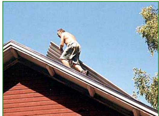
Peter kämpft mit den langen Platten.