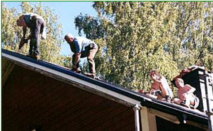
Jeder Handgriff sitzt.

Heute sind wir so richtig in Fahrt. Alles geht Hand in Hand, und eine Dachfläche nach der anderen wird zugedeckt.