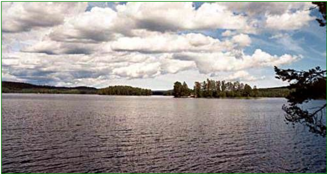
Die Hütte auf der Insel im See: Ein Urlaubsparadies.

Am Nachmittag beginnt die Freizeit. Als erstes erkunden wir den nahegelegenen See und fahren mit dem Boot zu den verschiedenen Hütten der Familienmitglieder. Ein Idyll ist die älteste Hütte, die auf einer Insel liegt. Dort könnte man wirklich für ein paar Tage abschalten, aber uns fehlt leider die Zeit dazu. Aber es gibt sicher ein nächstes Mal, und dann werden wir es genießen.