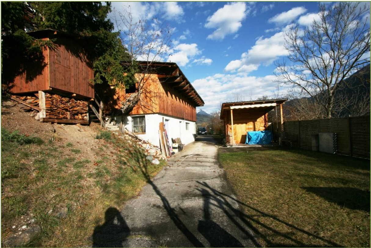
westlicher Teil des Grundstückes